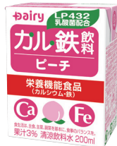
カル鉄飲料ピーチ