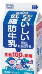
おいしい低脂肪牛乳