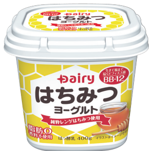
はちみつヨーグルト