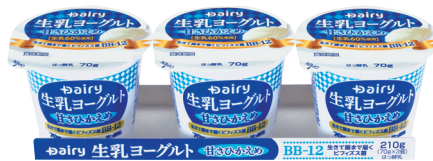
生乳ヨーグルト (甘さひかえめ)