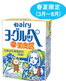
ヨーグルッペみやざき日向夏