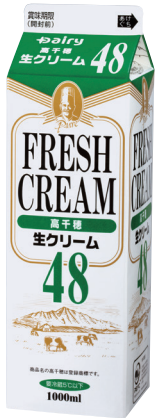
高千穂生クリーム48