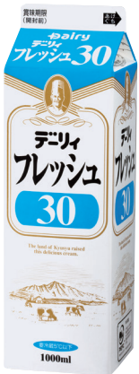
デイリーフレッシュ30