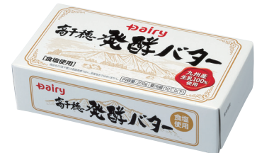
高千穂発酵バター