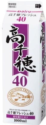
高千穂フレッシュ40