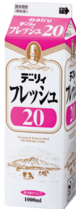
デイリーフレッシュ20