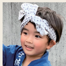
おてんばデーリィちゃん めぐみちゃん