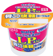
LP432骨こつ快朝ヨーグルト