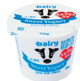
スイートヨーグルト