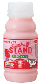
Sweet STAND いちごオレ