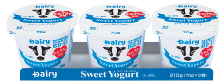
スイートヨーグルト