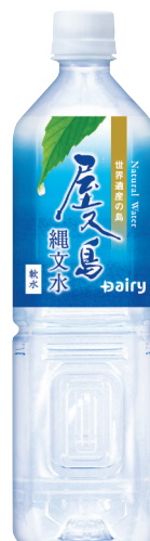
屋久島縄文水 PET 900