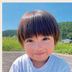
2022デーリィちゃん あおとくん