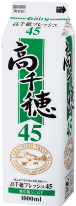
高千穂フレッシュ45