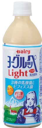
ヨーグルッペライト