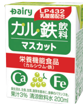
カル鉄飲料 マスカット