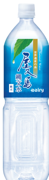
屋久島縄文水 PET 1500