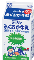
デーリィふくおか牛乳