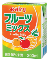
フルーツミックス