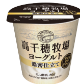
高千穂牧場ヨーグルト 濃密仕立て