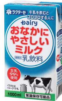
おなかにやさしいミルク