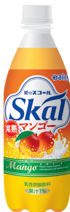
スコール完熟マンゴー PET500