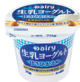
生乳ヨーグルト (甘さひかえめ)