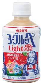
ヨーグルッペライトいちご