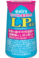
LP432ドリンクタイプ (機能性表示食品)