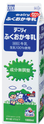
デーリィふくおか牛乳