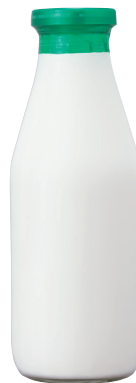
デーリー特選牛乳