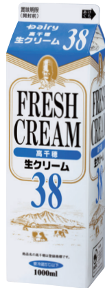
高千穂生クリーム38