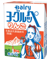
ヨーグルッペりんご