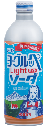
ヨーグルッペライトソーダ