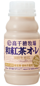
高千穂牧場和紅茶オレ