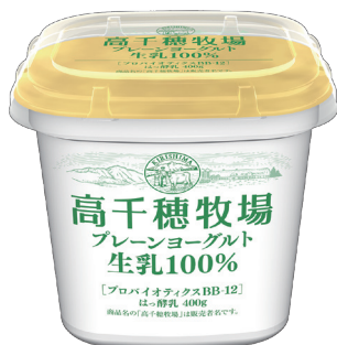
高千穂牧場 プレーンヨーグルト生乳100%