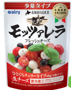
北海道日高乳業モッツァレラ ひとくちチェリータイプ