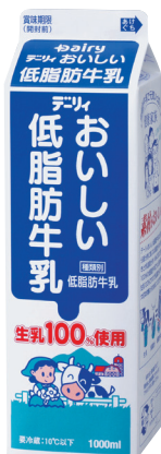
おいしい低脂肪牛乳