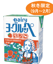
ヨーグルッペいちご