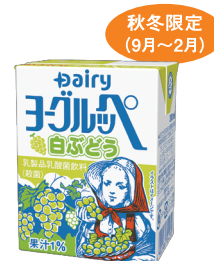
ヨーグルッペ白ぶどう