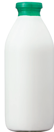
デーリー特選牛乳