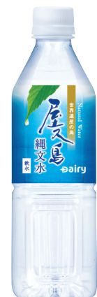
屋久島縄文水 PET 500