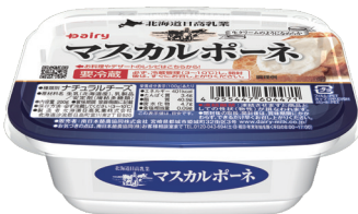
北海道日高乳業 マスカルポーネ