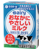
おなかにやさしいミルク