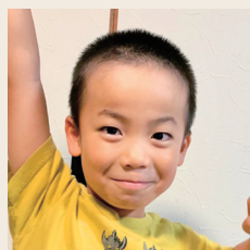
わんぱくデーリィちゃん かけるくん