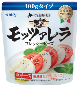
北海道日高乳業モッツァレラ 100gタイプ