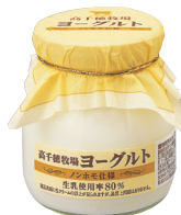
高千穂牧場ヨーグルト