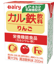
カル鉄飲料 りんご