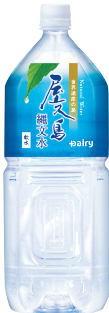
屋久島縄文水 PET 2000