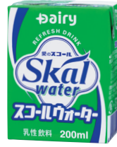
スコールウォーター