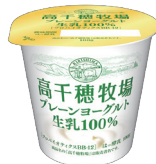
高千穂牧場 プレーンヨーグルト生乳100%