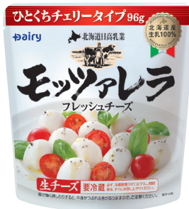
北海道日高乳業モッツァレラ ひとくちチェリータイプ