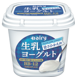
生乳ヨーグルト (甘さひかえめ)