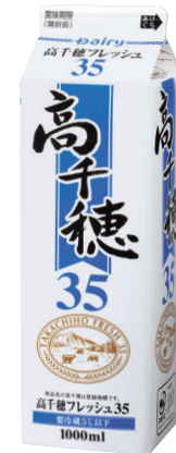
高千穂フレッシュ35