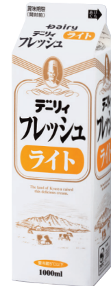
デイリーフレッシュライト