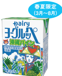
ヨーグルッペ沖縄パイナップル